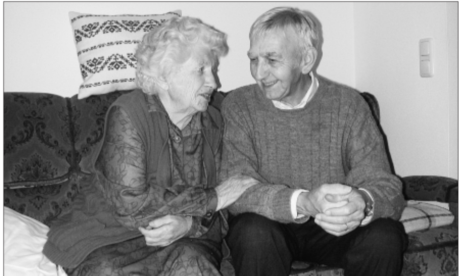
Mit Menschen reden, sie spüren – ein Grundbedürfnis aller Menschen.

Das Leben der in der Hausgemeinschaft lebenden BewohnerInnen wird jeweils von einer festen Bezugsperson begleitet. Diese Mitarbeiterin/diesen Mitarbeiter kann man als „AlltagsmanagerIn“ bezeichnen: Sie/er erledigt unterschiedliche Arbeiten wie Hilfe bei der Körperpflege, Hilfe beim Anziehen, Vorbereiten und Herichten von Mahlzeiten, Wäschereinigung in kleinem Ausmaß, Kontakt- und Beziehungspflege zum Bewohner/zur Bewohnerin und den Angehörigen. Ihre/seine ganzheitliche Rolle und Funktion entspricht der einer Hausfrau/eines Hausmannes in einem größeren Familienhaushalt. Sie/er wird unterstützt von Diplomiertem Gesundheits- und Krankenpflegepersonal für behandlungspflegerische und medizinische Pflegetätigkeiten. Entscheidend für das