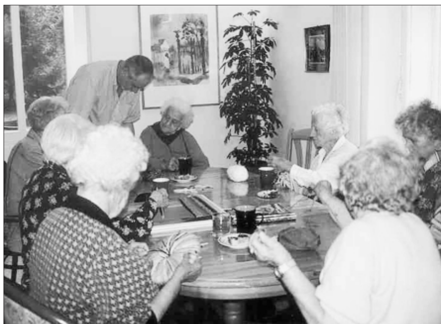
Haus für Senioren Graz – hier wird es nach dem Um- & Neubau Hausgemeinschaften geben.

Das Evangelische Diakoniewerk Gallneukirchen stellt sich der Herausforderung, diesen älteren pflegebedürftigen Menschen ein Leben zu ermöglichen, das sie an ihren normalen Alltag erinnert und hat sich deshalb