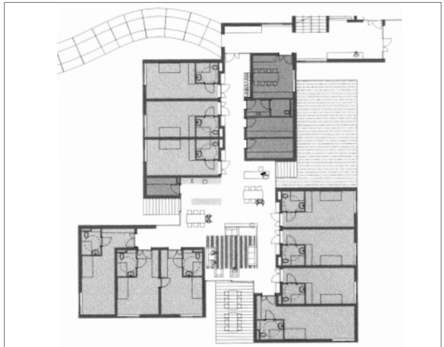
Grundriss einer Hausgemeinschaft.

Besonderes Augenmerk wird bereits in der Planungsphase auf das Farbkonzept und die Beleuchtung gelegt, z. B. können ältere Menschen satte, warme und hell leuchtende Farben gut erkennen, dagegen sind kalte Pastellfarben kaum zu unterscheiden. Eine helle und schattenarme Beleuchtung erleichtert das Wahrnehmen der Umgebung.